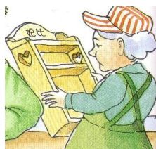
阿嬤給妃比的書架